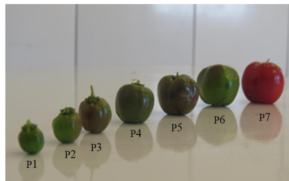
FIGURA 2. Vista frontal dos frutos de acerola classificados de P1 a P7. Ubajara-CE, 2014.

A produção de acerola possui duas finalidades no mercado, produção de polpas, sucos e consumo in natura onde as características mais importantes são teor de açúcar, textura e sabor, e indústrias de vitamina C, onde altos teores de ácido ascórbico e menores níveis de açúcar significa maiores