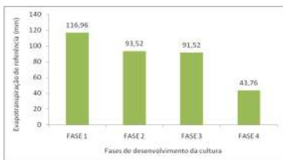
Figura 02 - Valores da Evapotranspiração de referência (mm), nos quatro estádios fenológicos da cultura do feijão.

A Figura 02 apresenta os valores da evapotranspiração de referência (mm), onde pode-se observar que as Fases 1 e 2 onde ocorreram os maiores valores de ETo (média diária de 4,03 e 3,89 mm.dia -1 respectivamente), compreendem os períodos que apresentaram maiores temperaturas e menores valores de umidade relativa do ar. Já para as Fases 3 e 4 (média diária de 2,34 e 1,75 mm.dia -1 respectivamente), houve um decréscimo nos valores de temperatura e aumento da umidade relativa do ar, isto justifica o fato da redução da média diária da ETo para estas fases.