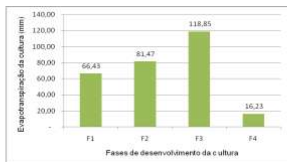
Figura 03 - Valores médios da evapotranspiração da cultura (mm), para os quatro estádios fenológicos da cultura do feijão, nos três tratamentos de irrigação.

Com os dados apresentados na figura 03, é possível perceber que houve um acréscimo da evapotranspiração da cultura a partir da Fase 1 até a Fase 3, onde alcançou o pico da evapotranspiração de 118,85 mm (média diária de 3,04 mm.dia -1 ), e onde ocorre o período que