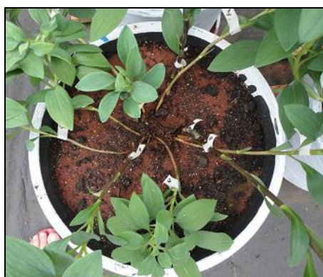
FIGURA 1. Vista superior de um vaso com substrato e uma muda de Alstroemeria Santa Maria, 2013.

O trabalho foi conduzido no Setor de Floricultura do Colégio Politécnico da Universidade Federal de Santa Maria, RS, em estufa climatizada. Os vasos ficaram no interior da estufa sob ripado de madeira. A época de cultivo iniciou em 18 de outubro de 2013 e findou em dezembro de 2014, permanecendo assim por um ano de produção. As mudas de Alstroemeria x hybrida foram adquiridas da hibridadora Holandesa Konst Alstroemeria, importada pela empresa Asista, de Holambra – SP. A variedade utilizada foi Firenze que possui flores de coloração em tons de laranja com traços marrom nas tépalas internas. Os vasos utilizados foram de plástico preto rígido com capacidade para 20l. Em cada vaso foi plantada uma única muda de Alstroemeria conforme pode ser observada na figura 1.