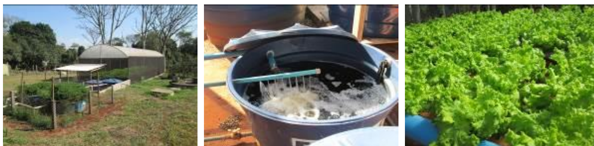
FIGURA 1. Estufa, reservatório com solução nutritiva e parcela experimental (CCA/UFSCar), 2014.

A figura 1 mostra a estufa, os reservatórios dos tratamentos e a parcela experimental.