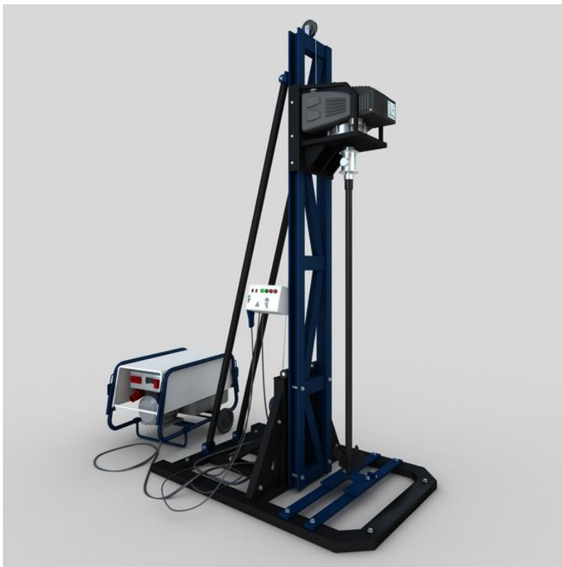
FIGURA 1: Equipamento de perfuração MGBU "Sigma-M".

MATERIAL E MÉTODOS: Foi utilizada a metodologia de análise e síntese funcional, conforme as recomendações de CARVALHO et al. , (2007), o método consiste na extração, a partir de um sistema técnico existente, de sua estrutura funcional, já a síntese funcional é o processo de criação de um novo sistema comparando-o com um sistema já existente. Utilizou-se o equipamento de perfuração MGBU "Sigma-M" da empresa russa KAMTEH como sistema técnico existente, o qual é usado para perfuração de poços semiartesianos. (Figura 1).