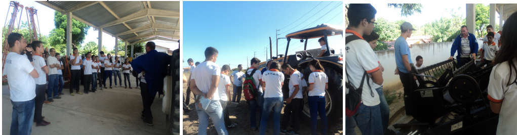
FIGURA 2. Atividades do dia de campo com a EEM Antonieta Siqueira .

Dois dias de campo foram implementados com estudantes do ensino médio da Escola Estadual EEM Antonieta Siqueira .