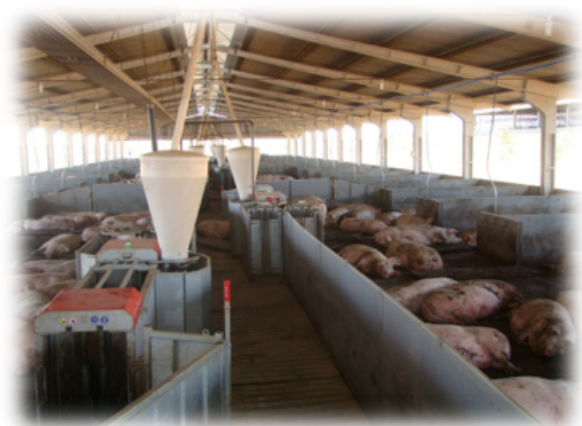
FIGURA 2. Matrizes suínas em grupos (Sistema 2).

De janeiro de 2011 a abril de 2014, os dados mensais de produção foram registrados durante a gestação (percentual de repetição de cio e taxa de abortamento) e a maternidade (taxa de parição, total de nascidos por parto, nascidos vivos por parto, mumificados, natimortos, peso do leitão ao nascer, desmamados por fêmea por ano, mortos ao desmame, nascidos por fêmea por ano e peso ao