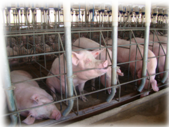
FIGURA 1. Matrizes suínas em gaiolas (Sistema 1).

MATERIAL E MÉTODOS: Para este estudo, foram coletados dados de uma granja de suínos localizada no PAD-DF (Programa de Assentamento Dirigido do Distrito Federal), que atualmente utiliza ambos os sistemas de alojamento. Desse modo, as condições topográficas, climáticas e sanitárias não interferiram na avaliação. No Sistema 1 (convencional), as primíparas foram inseminadas em gaiolas individuais e, após 42 dias foram encaminhadas para baias de 3,0 X 3,4 m, distribuídas em grupos de quatro. As múltiparas eram apenas alojadas em gaiolas, desde a inseminação até o final da gestação (Figura 1). Havia aproximadamente 2.700 animais. Já o Sistema 2 consistiu em baias coletivas contendo em cada uma 80 animais e um comedouro individual automatizado, totalizando aproximadamente 1.500 animais (Figura 2).